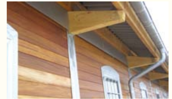
7 Dachüberstand und Traufenlüftung