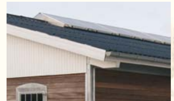
8 Der Lichtfirst aus Doppelstegplatten ist besonders wärmeisolierend