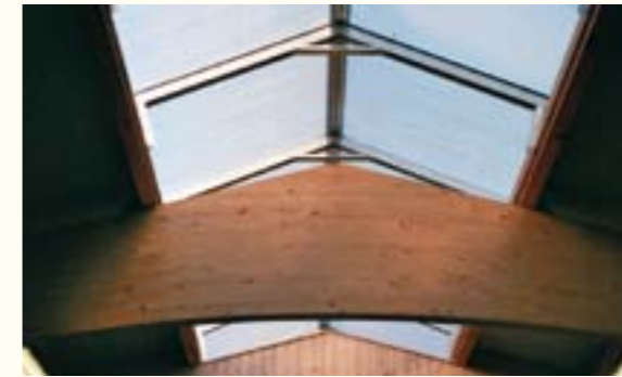
3 Lichtfirst aus Aluminium-Tragkonstruktion und isolierenden Doppelstegplatten