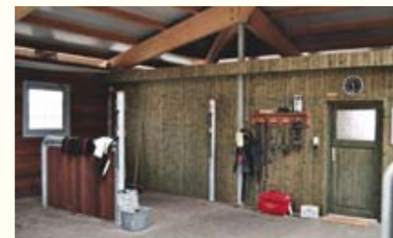
5 Die Innenausstattung erfolgt nach individuellen Wünschen