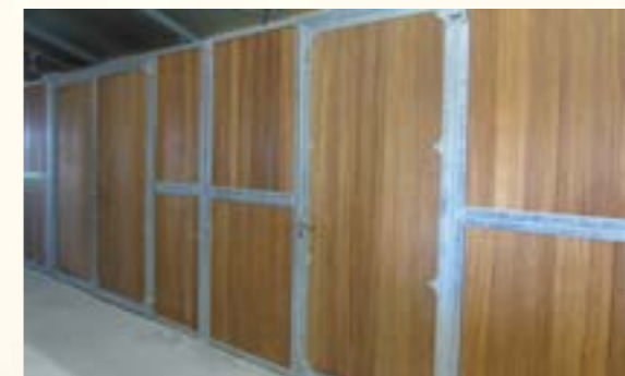
6 Ausstattungsbeispiel: Sattelkammer