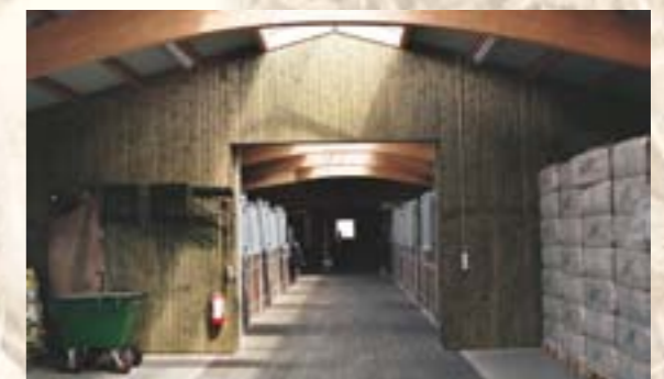
10 Ausstattungsbeispiel eines Stalls mit Leimbinderkonstruktion: Lagerraum