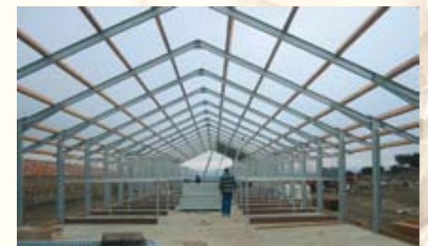
9 Die freitragende Stahlkonstruktion ist die Basis für einen kostengünstigen Innenausbau