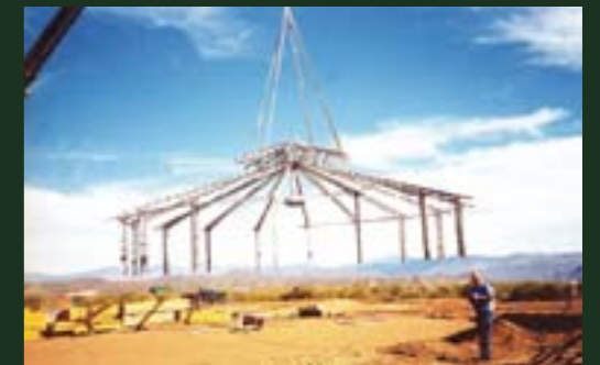
Bild 11: Windschutznetz bei einer „Premium“-Rundhalle